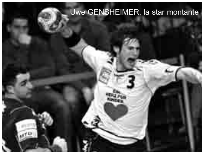
Uwe GENSHEIMER, la star montante

grands d'Europe souhaitent avoir dans leurs rangs, un diable de pivot croate nommé